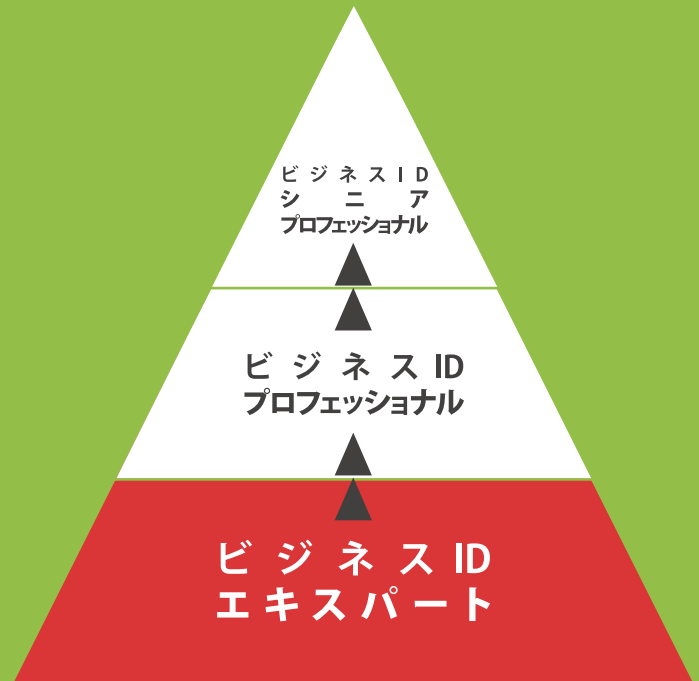
ビジネスID認定体系